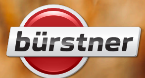
Abbildung beinhaltet Bürstner Individual Sonderausstattungen