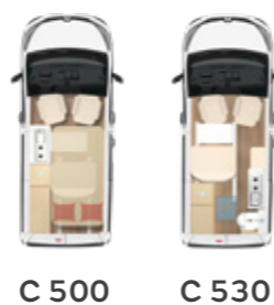
C 500 C 530

Angabe der Maximalwerte in dieser Baureihe.