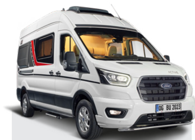
Der großzügige Spontane